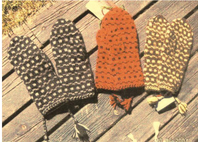
Exempel på Kalix-vantar

Flätor och tofsar: Gör två flätor och två tofsar och fäst dem i vanten längst ned motstående sida till tummen.